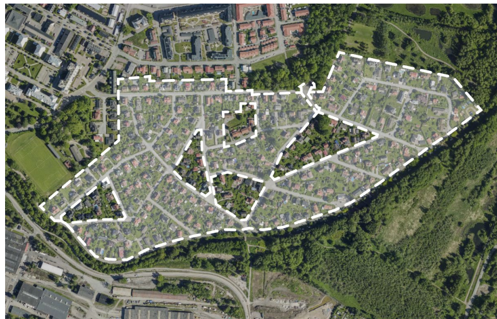
Bild på planområde

Planområdet ligger i stadsdelen Rynninge i centrala Örebro. Området utgörs av ett befintligt villaområde.