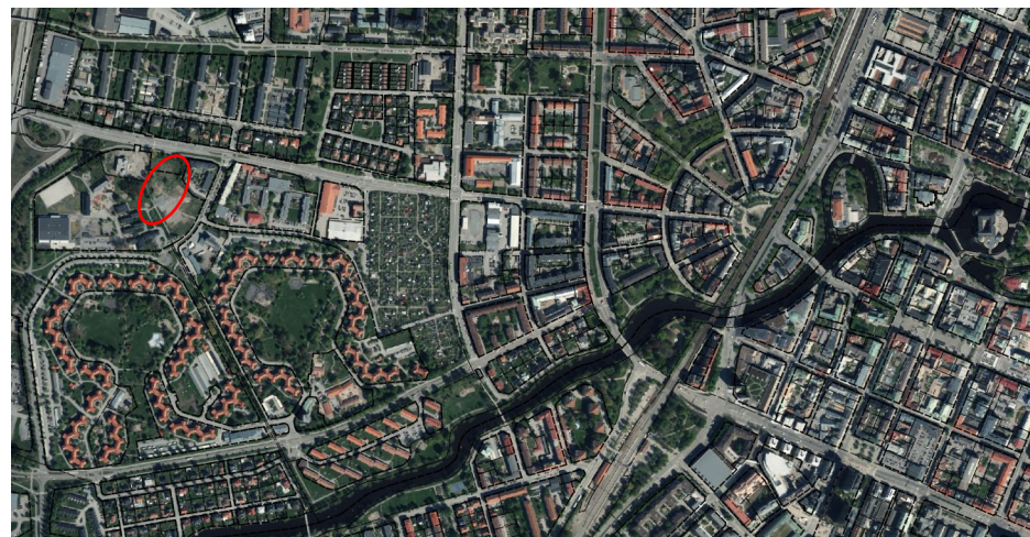
Bild på planområde

Området som berörs av planändringen ligger inom fastigheten Stjärnkikaren 3 samt Längbro 1:121 i västra Örebro. Området är i dagsläget planlagt för skoländamål och innefattar bl.a. Rostaskolan och dess utemiljöer.