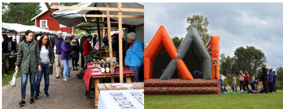
Marknaden och hoppborgen lockade olika besökare under dagen.

Ervalladagen startade för tio år sedan och hålls vartannat år. Nästa höst anordnar LRF traditionsenligt ett traktorrace med tillhörande marknad. ■