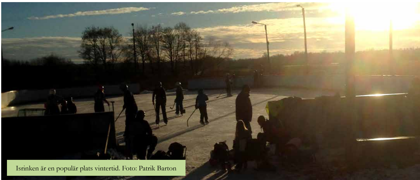
Isrinken är en populär plats vintertid.

– Om aktiviteten är rolig även för vuxna blir det också fler som engagerar sig.