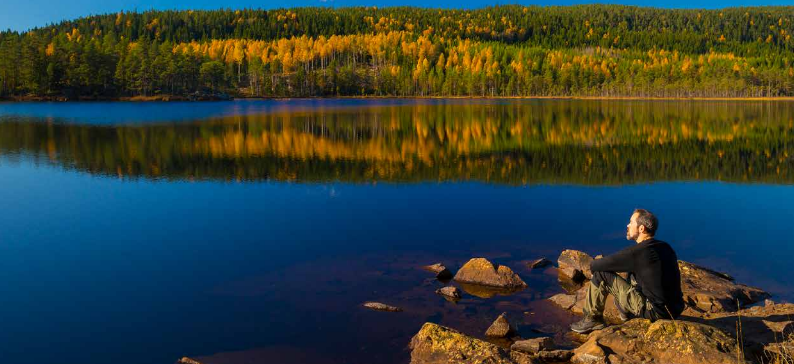
Lugnet i naturen tilltar alla typer av turister.

Örebrokompaniet leder och samordnar marknadsföringen av Örebro. Deras satsning på vår kommuns landsbygd har pågått under lång tid och man fortsätter att driva utvecklingen av naturturism vidare.