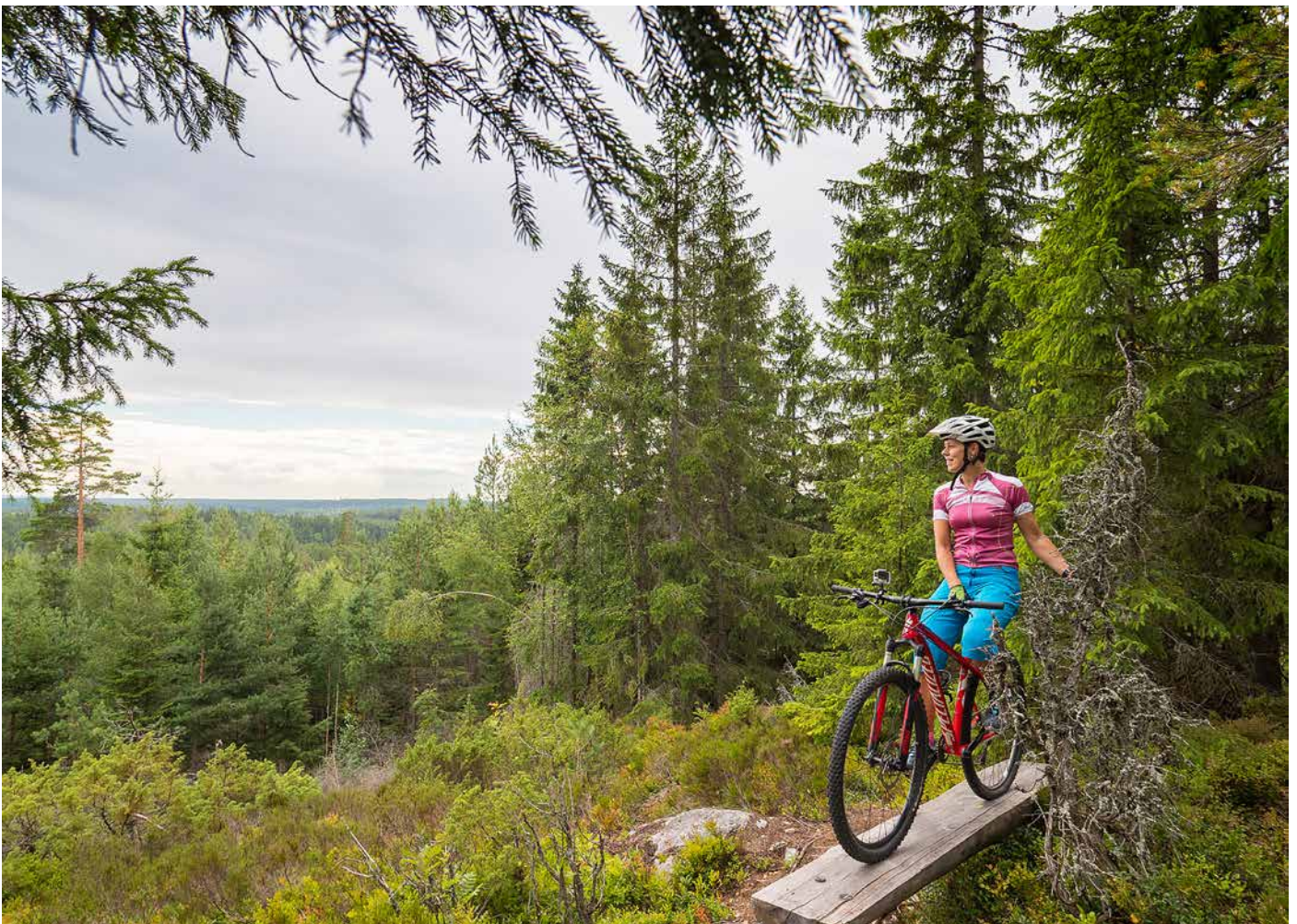
Ännaboda erbjuder många natursköna vyer som kan kombineras med olika aktiviteter.

När det finns motstånd tar vi det på allvar, det finns ingen anledning för oss att satsa om vi inte får med oss de boende i området. Jag hoppas att folk hör av sig om det finns kritik. Jag välkomnar konstruktiva diskussioner. Naturen är en av våra största tillgångar och att arbeta med lokalbefolkningen är superviktigt. ■