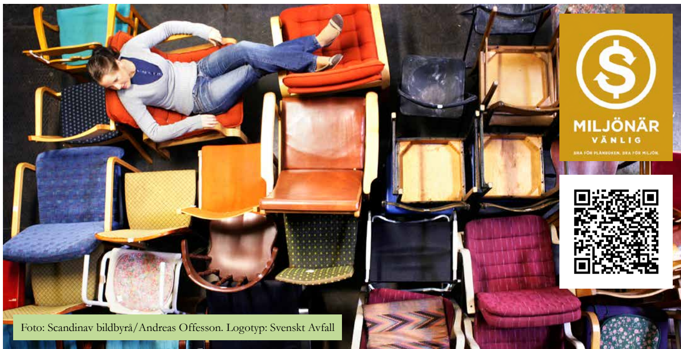
Foto: Scandinav bildbyrå/Andreas Offesson. Logotyp: Svenskt Avfall