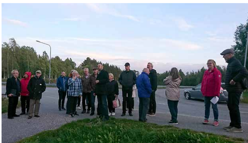
Förbättringspromenad i Glanshammar, 20 september 2018.

bor. Därför är Landsbygdsnämnden viktig och det är just vid medborgardialogerna som vi får fram olika synpunkter. Det är positivt att folk i alla åldrar får komma till tals. ■