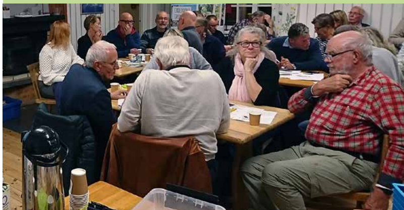
Medborgardialog i Bocksboda, 11 oktober 2018.