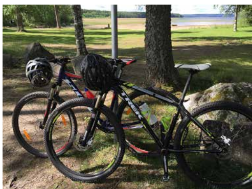
Foto: Solbergabadet är en ny punkt på kartan.

Den färdiga kartan kommer bland annat att finnas tillgänglig på alla informationspunkter i Östernärke, på Tegelhuset och hos alla annonserande företag. ■