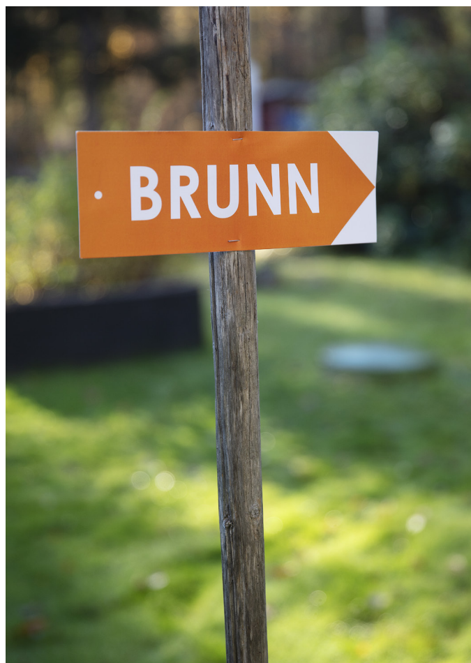
Exempel på hur du kan märka ut din anläggning.

Du som fastighetsägare har ansvar för att kontrollera ditt eget avlopp enligt tillverkarens anvisningar. Det är viktigt att du gör regelbundna kontroller, så att eventuella problem eller fel upptäcks och kan åtgärdas. Checklista hittar du på orebro.se/enskiltavlopp .