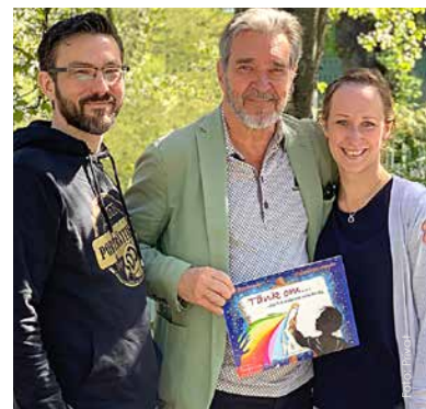
Familjen Bergqvists insamlingsstiftelse verkar för att på olika sätt hjälpa och stärka människor i behov av stöd.