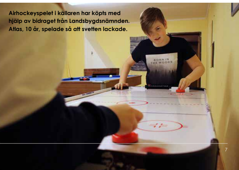
Airhockeyspelet i källaren har köpts med hjälp av bidraget från Landsbygdsnämnden. Atlas, 10 år, spelade så att svetten lackade.