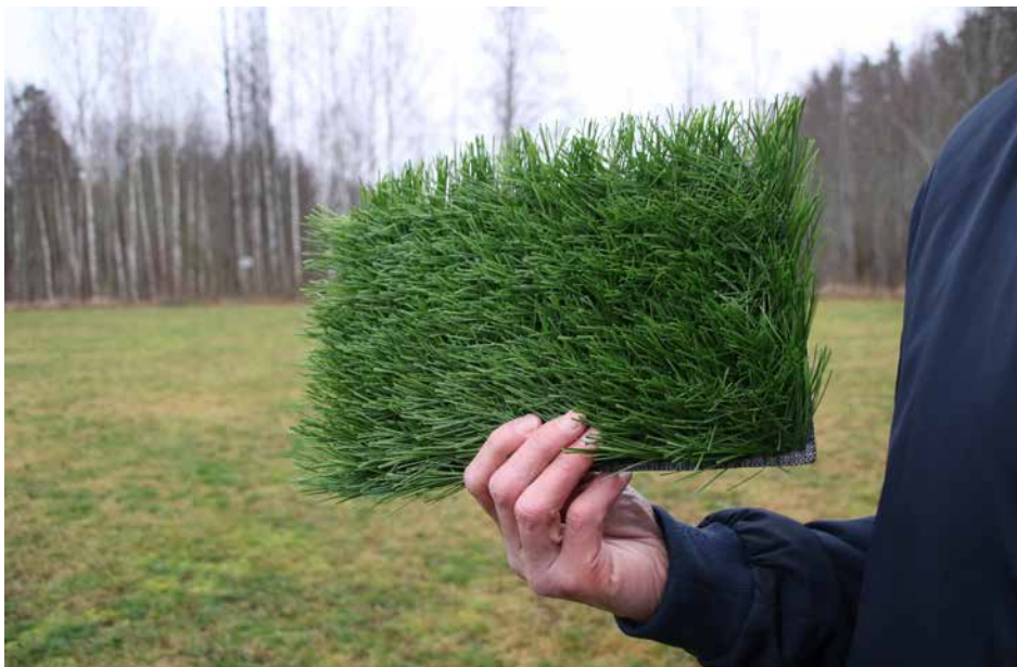
Den här typen av konstgräs har Latorps IF bestämt sig för. Under förutsättning att klubben får bidrag från Allmänna arvsfonden och tidsplanen hålls ska planen bakom ha konstgräs till våren 2021.

– Det är många föreningar som får slåss om tiderna på anläggningarna i Karlslund och Mellringe, ofta på ganska obekväma tider. Vi lägger 60-70 000 kronor på det nu och det är