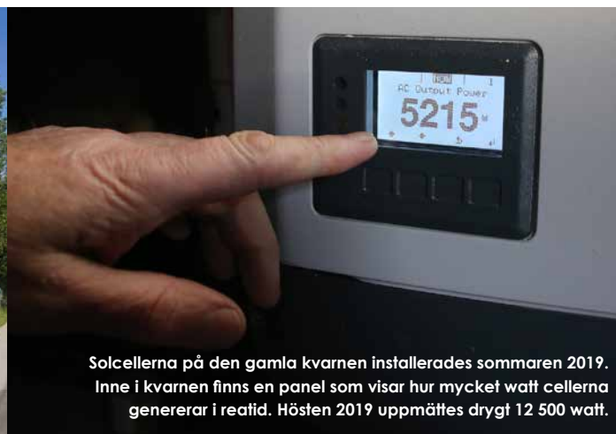
Solcellerna på den gamla kvarnen installerades sommaren 2019. Inne i kvarnen finns en panel som visar hur mycket watt cellerna genererar i realtid. Hösten 2019 uppmättes drygt 12 500 watt.

Centralt i Klockhammar ligger Kvarndammen som sommartid är en populär badplats. Här ligger även den gamla kvarnen som var i drift fram till 1944. I somras installerades solceller på kvarnens tak. Elen som genereras används till att täcka vattenverkets elkostnader.