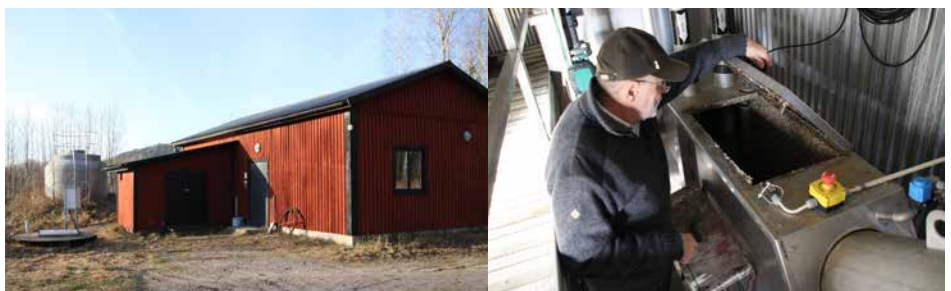
I reningsverket finns både kemisk och biologisk rening. Allt som inte hör hemma i avloppsvattnet fastnar i en speciell maskin och lämnas vidare till förbränning.

– Vi har aldrig haft något problem. Vi har väldigt bra vatten.