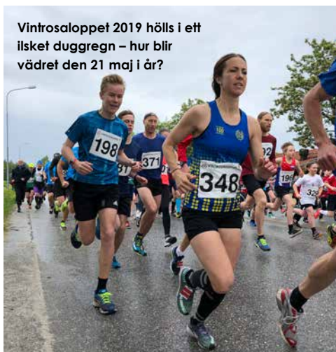
Vintrosaloppet 2019 hölls i ett ilsket duggregn – hur blir vädret den 21 maj i år?