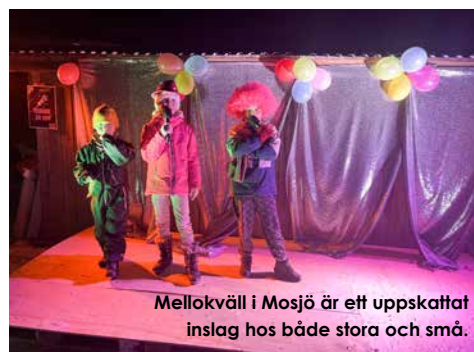
Mellokväll i Mosjö är ett uppskattat inslag hos både stora och små.

– Landsbygdspriset blir en bekräftelse på att det vi gör är bra