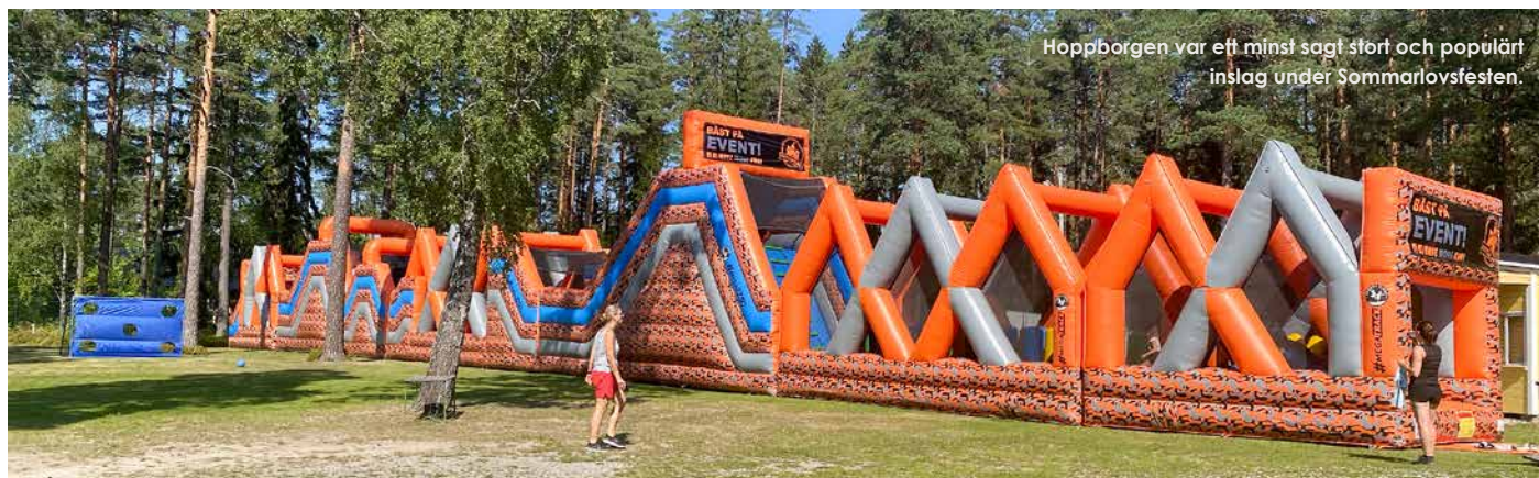
Hoppborgen var ett minst sagt stort och populärt inslag under Sommarlovsfesten.

Det blev sex föreningar som gick ihop: Tysslinge Kulturförening, Garphyttans IF, Garphyttans folketshus och parker, Scouterna Garphyttans frikyrkoförsamling, Garphytte Skytteföreningen och Tysslinge företagare. Under dagen bjöds det på bland annat hoppborg, bangolf, backklätt-