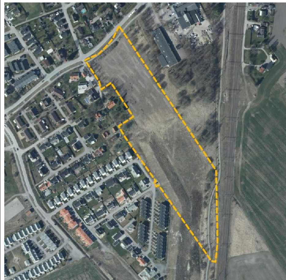
Bild på planområde

Planområdet ligger i Mosås ca 15 kilometer söder om centrala Örebro.