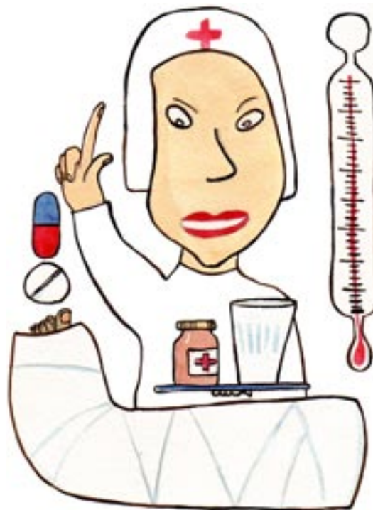
RAHAT EIVÄT KORVAA MURTUNUTTA JALKAA.