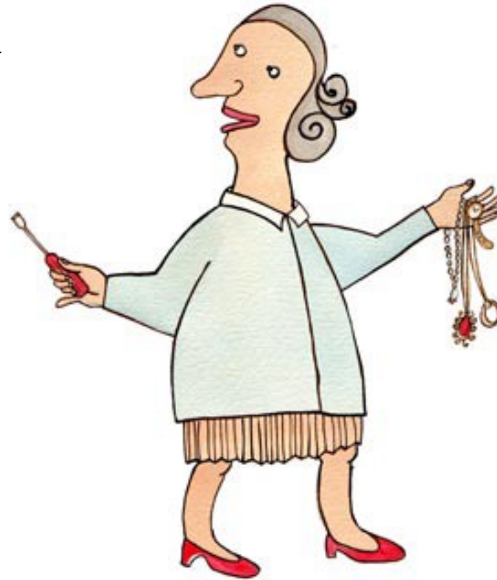
KÄTKKE KORUT JA RAHAT EPÄTAVALLISIIN PAIKKOKIIN.