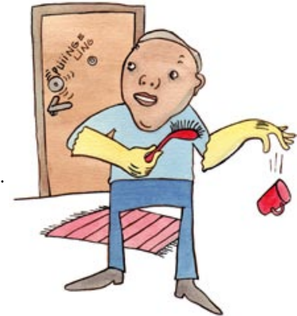
ANNA KUULUA ITSESTÄSI, OSOITA OLEVASI KOTONASI.