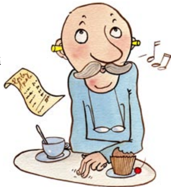
MITÄ HARVEMMIN OTAT ESIIN LOMPAKON, SEN PAREMPI.

Pidä silmälaseja taskussasi, jotta sinun ei tarvitsisi avata laukkuja niiden esiin saamiseksi.