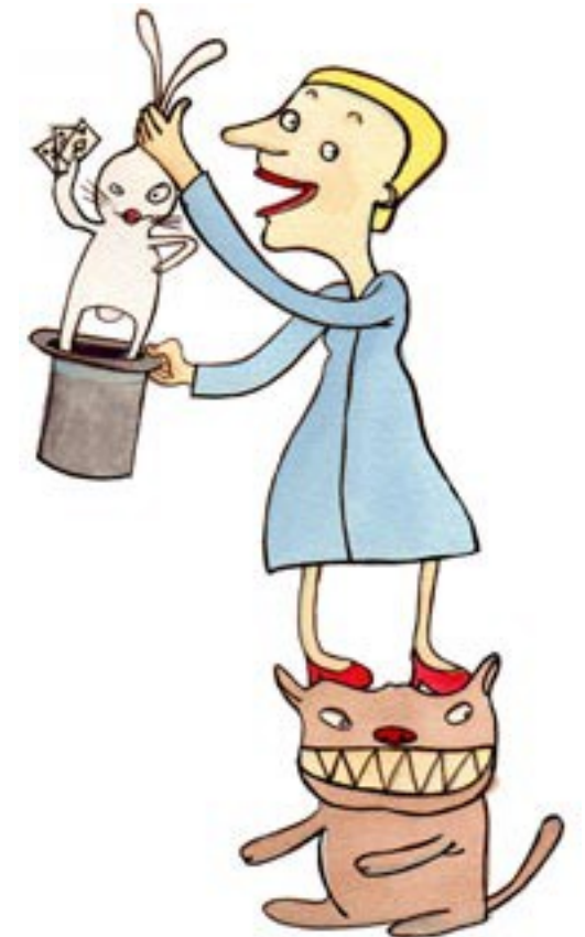
ÄLÄ ANNA TOISTEN HEIKENTÄÄ TARKKAAVAISSUUTTASI.

Jos jotakin sattuu, on suuri merkitys sillä, että pystyt kuvailemaan henkilöt. Tämä helpottaa huomattavasti poliisin työtä.