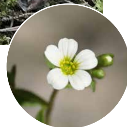
Hällebräcka ( Saxifraga osloënsis )

extra stort ansvar för att bevara och se till att den inte minskar i antal. Hällebräcka är en korsning mellan klippbräcka och grusbräcka och blommar i maj-juni med vita blommor som liknar mandelblom.