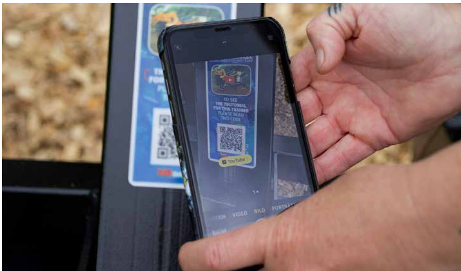
Med hjälp av din mobiltelefon kan du på varje maskin scanna en QR-kod. På så vis får du genom en video veta hur du ska använda maskinen på rätt sätt.