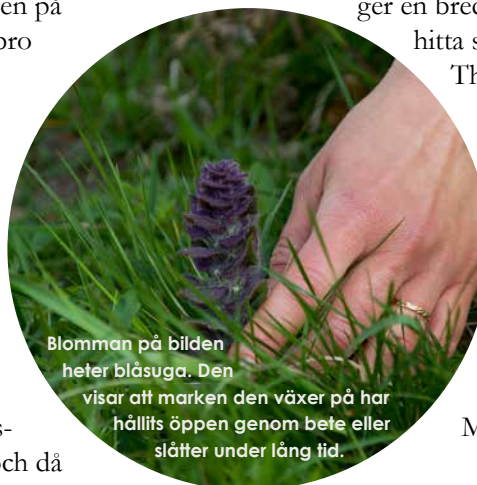
Blomman på bilden heter blåsguga. Den visar att marken den växer på har hållits öppen genom bete eller slåtter under lång tid.