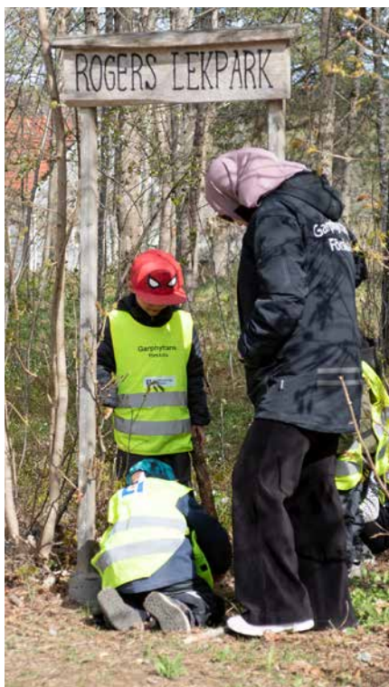
Skyllten är gjord av Olle Davidsson och har suttit uppe vid lekparken sedan 2013.

Parkens utseende har förändrats lite den senaste tiden, men är fortfarande en stor och uppskattad lekplats.