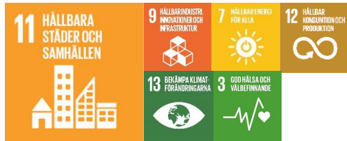
Figur 6 Ovanstående ikoner illustrerar vilka mål i Agenda 2030 som huvudsakligen inkluderas i målområdet Örebro skapar livsmiljöer för god livskvalitet .

Målområdet Örebro skapar livsmiljöer för god livskvalitet handlar om de rumsliga strukturer som tillsammans gör kommunens tätorter och landsbygder inkluderande, säkra, motståndskraftiga och hållbara. Genom fysisk planering, hållbar förvaltning och utveckling av våra livsmiljöer skapas hållbara bebyggelse- och infrastrukturer samtidigt som hushållningen av våra mark- och vattenområden är god.