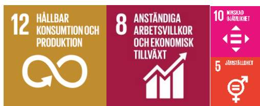
Figur 8. Överstående ikoner illustrerar vilka mål i Agenda 2030 som huvudsakligen inkluderas i målområdet hållbara och resurseffektiva Örebro.

Vår beskärda andel relaterar till hur mycket av jordens resurser som kan förbrukas av var och en av oss under förutsättning att resurserna fördelades helt lika mellan alla människor på jorden. Det ekologiska fotavtrycket ska vara på en nivå som, om det tillämpas globalt, inte äventyrar jordens ekosystem. Vi sätter mål i relation till vår påverkan totalt, oberoende av var den inträffar. Och vi relaterar till den globala befolkningens storlek.