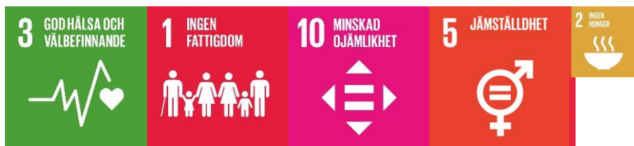
Figur 5. Ovanstående ikoner illustrerar vilka mål i Agenda 2030 som huvudsakligen inkluderas i målområdet ett tryggt och gott liv för alla i Örebro.

Målområdet Ett tryggt och gott liv för alla i Örebro handlar om att ingen ska lämnas utanför i utvecklingen och att säkerställa att de invånare som har särskilda behov får möjlighet att nå sin fulla potential. Målområdet handlar om stödsatser och lösningar för personer utifrån behov, men bygger på att målområde ett och två också är realiserade.