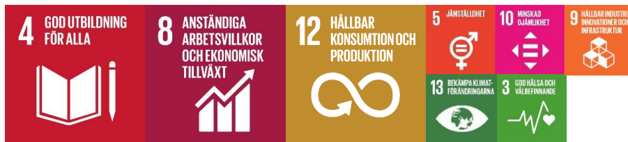
Figur 4. Ovanstående ikoner illustrerar vilka mål i Agenda 2030 som huvudsakligen inkluderas i målområdet lärande, utbildning och arbete genom hela livet i Örebro.

Målområdet Lärande, utbildning och arbete genom hela livet i Örebro handlar om likvärdig utbildning av god kvalitet för alla, livslångt lärande och bildning. Området handlar även om tillfredsställande och meningsfull sysselsättning samt om innovation och näringslivsutveckling för en hållbar samhällsutveckling.