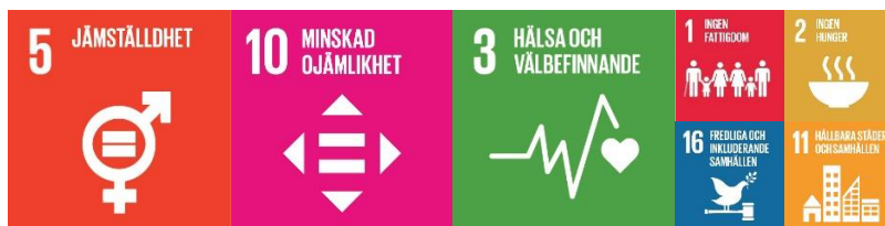
Figur 3. Ovanstående ikoner illustrerar vilka mål i Agenda 2030 som huvudsakligen inkluderas i målområdet Örebro i sin fulla kraft.

Målområdet Örebro i sin fulla kraft handlar om ett jämställt och jämlikt samhälle. När alla människors grundläggande behov och rättigheter tillgodoses finns förutsättningar för demokratiska, fredliga och inkluderande samhällen.