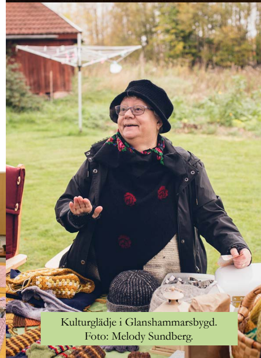
Kulturglädje i Glanshammarsbygd.