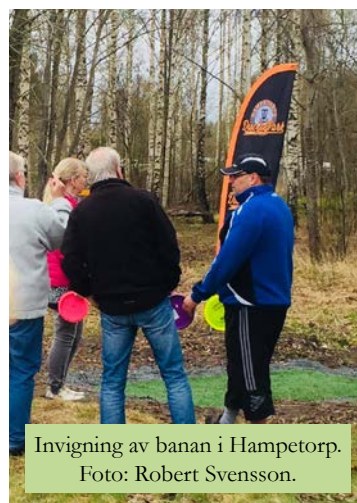
Invigning av banan i Hampetorp.

Vintrosa Idrottsällskap , kunde 10 maj i år genomföra det mycket populära Vintrosaloppet för första