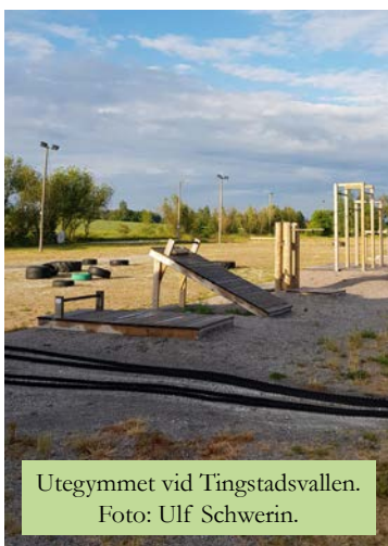
Utegyttet vid Tingstadsvallen.

Dylta Mattcurling seniorer har fått startbidrag för föreningar på landsbygden. Ansökan specificerades till en ny matta och stenar för att kunna utöva sporten. Med den nya mattan och stenarna kan föreningen nu utöva aktiviteten på hemmaplan i Ölmbrotorp.