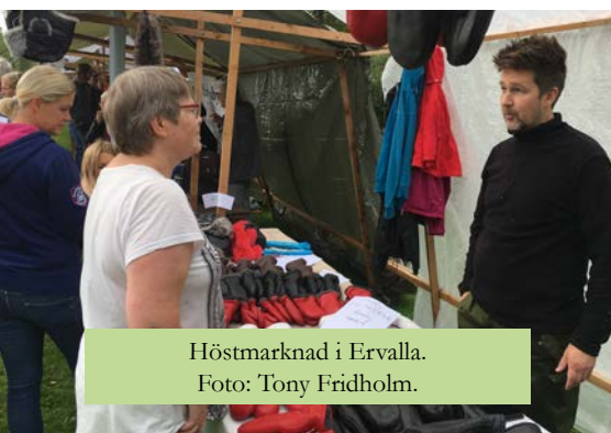
Höstmarknad i Ervalla.