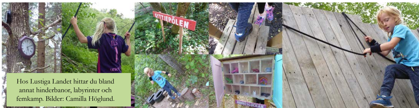
Hos Lustiga Landet hittar du bland annat hinderbanor, labrynter och femkamp.