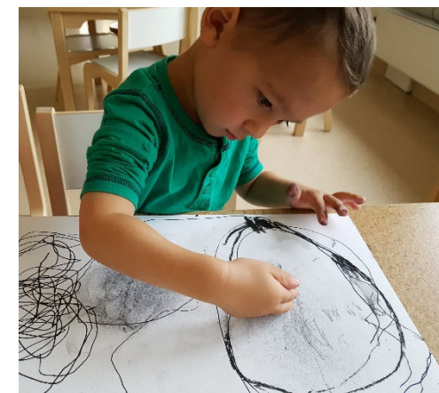
Min tanke tar form på pappret