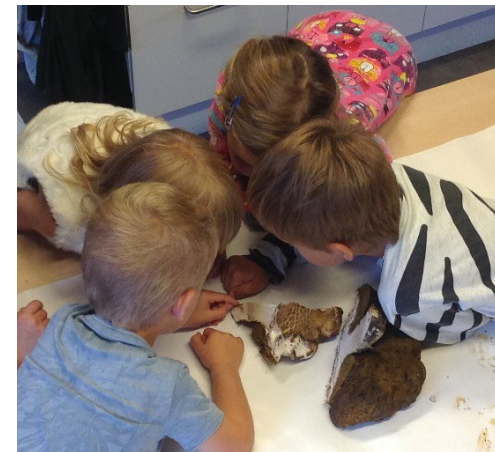
I ett undersökande tillsammans