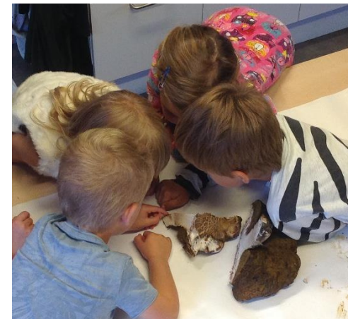
I ett undersökande tillsammans