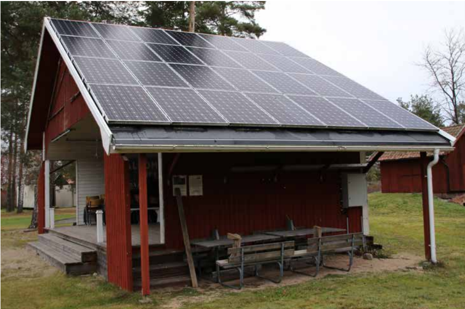
Solcellspaneler finns lite överallt på Vinön redan i dag. På scenen vid skolan sitter det sedan snart tio år solceller på ena taksidan.