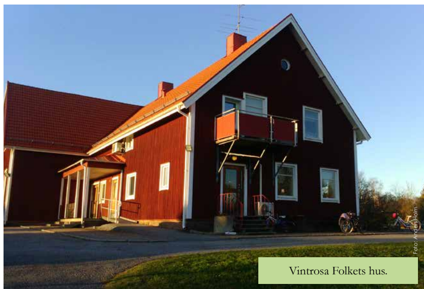
Vintrosa Folkets hus.

– Laddstolparna blir i en andra etapp till våren. Då kommer vi se till att finnas på Sverigekartan över laddstolpar. I dagsläget finns det inte många stationer att ladda på om man kommer från Norgehållet mot Örebro. Det är bra att få lite mer regional täckning. ■