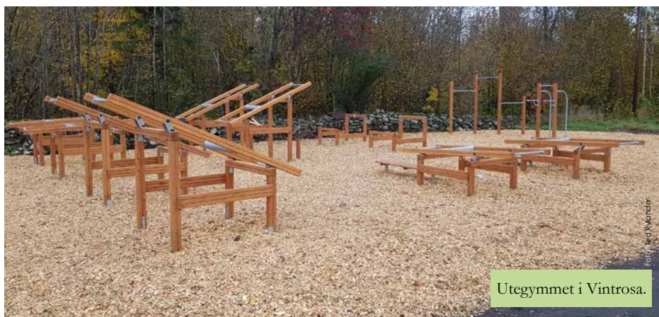
Utegymmet i Vintrosa.