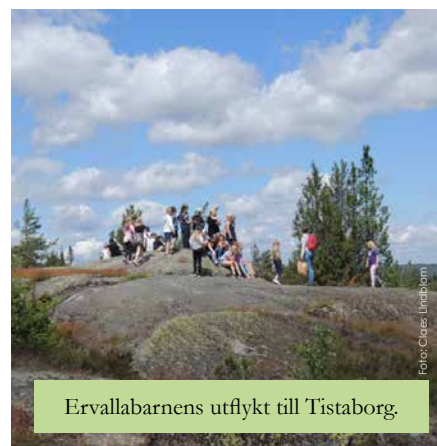
Ervallabarnens utflykt till Tistaborg.

För att få ut mesta möjliga av allt arbete har hembygdsföreningen även gjort en utställning på hembygdsgården. ■