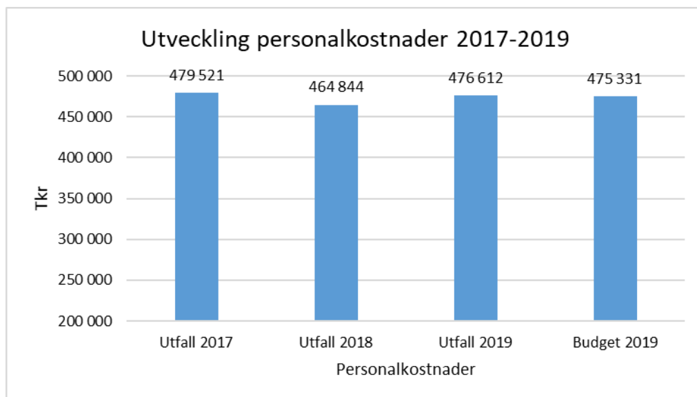
Diagram ovan visar att utfall för personalkostnader ligger strax under utfallet för 2017, men över utfallet för 2018. Utfall för 2019 ligger strax över budgeten, viktigt att ha i beaktande däremot är att vissa tjänster helt eller delvis finansieras av statsbidrag som i vissa fall inte är budgeterade beroende på tidpunkten för tillkännagivandet av olika statsbidrag. Kostnaden för att behålla samma personal ökar med årlig lönerrevision, vilket gör att man i jämförelse mellan åren behöver ha det i beaktande. Budgetkompensation för lönerrevision var under 2019 9,0 mnkr.

Tabell ovan visar att nettoutfallet 2019 är 14,1 mnkr högre än utfallet för 2018. Avseende kapitalkostnader så syns det tydligt i utfallet att nämnden vidtagit åtgärder för att minska denna kostnadspost, vid jämförelse mellan 2018 och 2019. Tabellen visar även stora avvikelser mellan åren för intäkter och övriga kostnader. Detta beror på att man från och med 2019 ändrat tillämpning gällande att redovisa interna köp och sälj mellan enheterna jämfört med 2018. Detta har ingen nettoeffekt på nämnden som helhet. Kostnadsutvecklingen avseende personalkostnader beskrivs tydligare i efterföljande diagram.