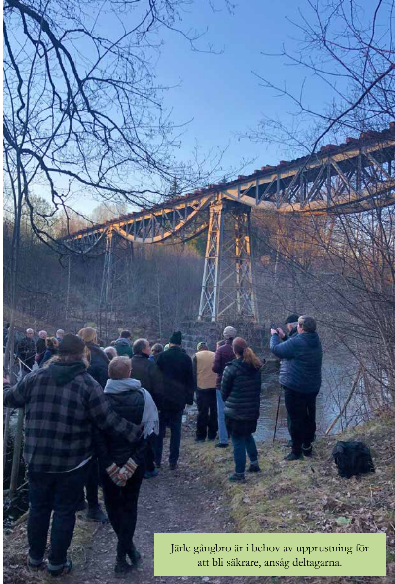
Järle gångbro är i behov av upprustning för att bli säkrare, ansåg deltagarna.

På Fridhem förskola och skola genomfördes i slutet av maj en elevdialog. Barnen ser många fördelar med att bo eller gå i skolan på landet, bland annat närheten till skogen, den friska luften och lugnet. Barnen saknar dock cykelvägar, en mataffär i närheten och fler bussar. Dessutom är det