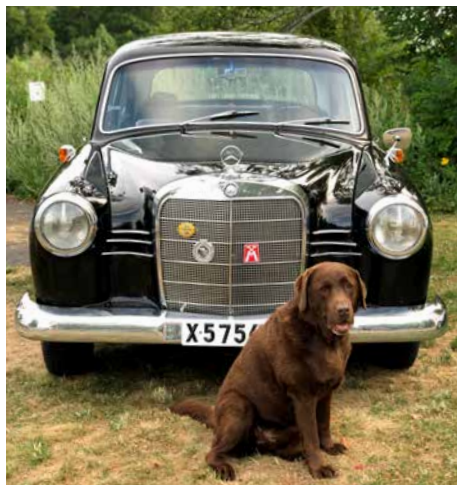
Nerikes Fordonshistoriker visade upp veteranbilar vid Ässundet även 2018.

3/8: Spelmansstämma, Brevens hembygdsgård 7/8: Musikkväll, Ässundet 9/8: Allsångskväll, Brevens hembygdsgård 10/8: Sommarmusik i Rinkaby kyrka 10/8: Tomas Di Leva, Vinöns värdshus 17/8: Vintrosadagen 17/8: Vintrosa beachhandbollscup