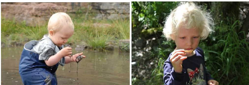
Vatten och gegg, småkryp och andra djur.

Fantasilekar är ofta utforskande, och lek med lösa material, sand och vatten är ofta experimenterande. Den kreativa och den utforskande leken överlappar på så sätt varandra, och det här avsnittet kan se som en förlängning av det förra. Utforskandet är på samma sätt som det egna skapandet ett otroligt centralt tema i barns lek. Små barn behöver inga uppmaningar att undersöka hur världen runt omkring dem fungerar, det har de ett eget inneboende driv att göra. I vår kultur begränsar vi vuxna ofta barns möjligheter att utforska och lära – genom vår rädsla för att de ska göra sig illa, eller motvilja mot att de blir blöta och smutsiga. Men vi behöver kreativa problemlösare i framtiden! Därför behöver vi erbjuda våra barn rika miljöer fulla av möjligheter, och även ge dem frihet att få experimentera och upptäcka vad som finns i vår värld.