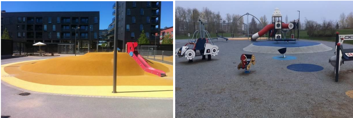
KFC. En steril förskolegård i Stockholm och en dyr lekplats i Örebro. En samling lekredskap på gummimatta. I Sverige är inte staket lika vanligt runt lekplatser som i Storbritannien.

Vår tids lekredskap har kanske en mer påkostad design än de hade på 70-talet, men en lekplats som endast består av en samling redskap uppställda på en platt yta har lika lågt lekvärde idag som den hade då. Vilken typ av egenskaper och innehåll som ger högt lekvärde kan du läsa mer om senare i skriften. Men först måste vi fråga oss: varför byggs det fortfarande så många av den här typen av endimensionella lekplatser?