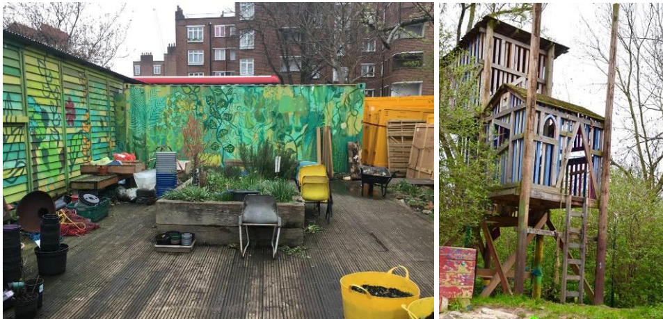
Bilder från adventure playgrounds i London. Barnen är medskapare i allt i lekmiljön.