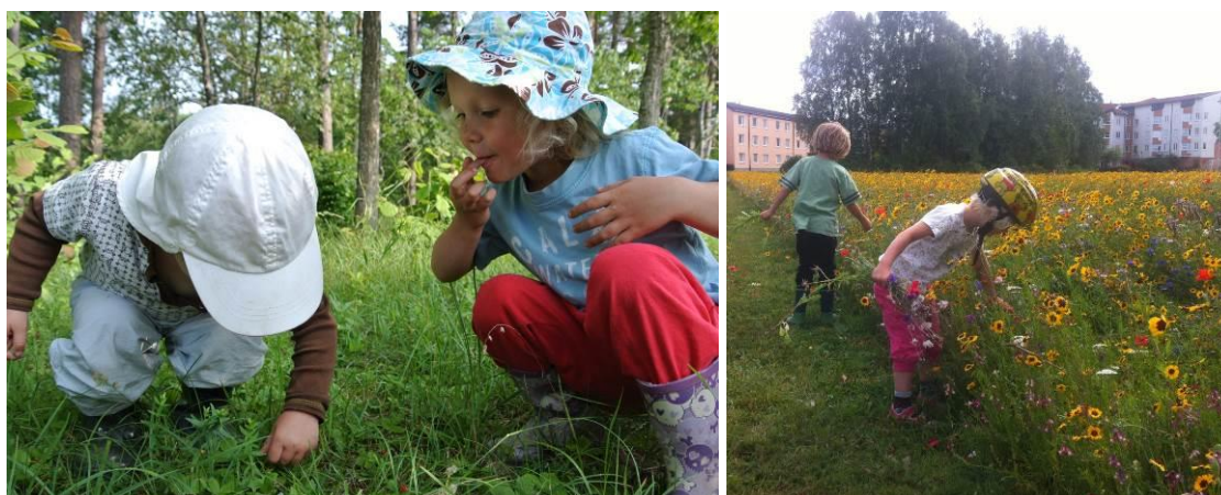
Smultron och blommor att plocka.

En väl utformad lek miljö ger möjligheter till olika former av sinnesupplevelser. Känna olika lukter, höra olika ljud, möjlighet att smaka på till exempel bär, och en rikedom av olika material med olika egenskaper – runda, kantiga, mjuka, hårda, släta, stickiga, kala, håriga och så vidare. Naturmiljöer erbjuder ofta rika sinnesupplevelser, som kan förstärkas med ytterligare planteringar och med olika byggda element. För allt fler barn är lekplatser och de platser som de besöker med förskola och skola den enda kontakt de får med någon form av natur. I urbana och hårdgjorda miljöer behöver vi därför återskapa natur och skapa förutsättningar för att uppleva de olika årstidernas skiftningar och förändring av miljön. Vi behöver göra det möjligt att höra naturljud som rinnande vatten, prassel av löv, eller fågelsång. Ge tillgång till bärbuskar där man kan smaka på till exempel smultron och hallon, anlägga blomsterängar där det är tillåtet att plocka blommor. Och se till att det finns geggpölar där man kan pressa lergeggan genom fingrarna och tårna.