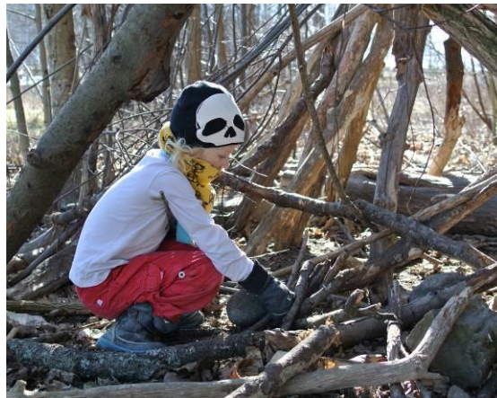
Lösa material att samla, bygga med, skapa med...