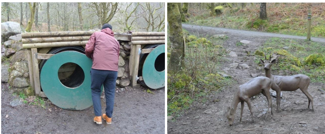
Hobbithus, hjortar, samt en inspirerande vattenleksmiljö.