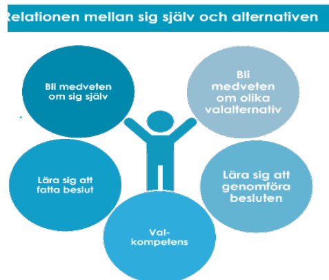
Figur 2 Skolverkets definition av valkompetens

För att hantera valsituationer behöver eleven utveckla ett antal kompetenser som visar på strukturerade sätt att samla, analysera, sätta samman och organisera sig själv och utbildnings- och yrkesinformation samt ha färdigheter att kunna fatta och genomföra beslut och hantera övergångar och växlingar i livet. 9 Med andra ord ska eleven ges möjlighet att utveckla en så kallad valkompetens.