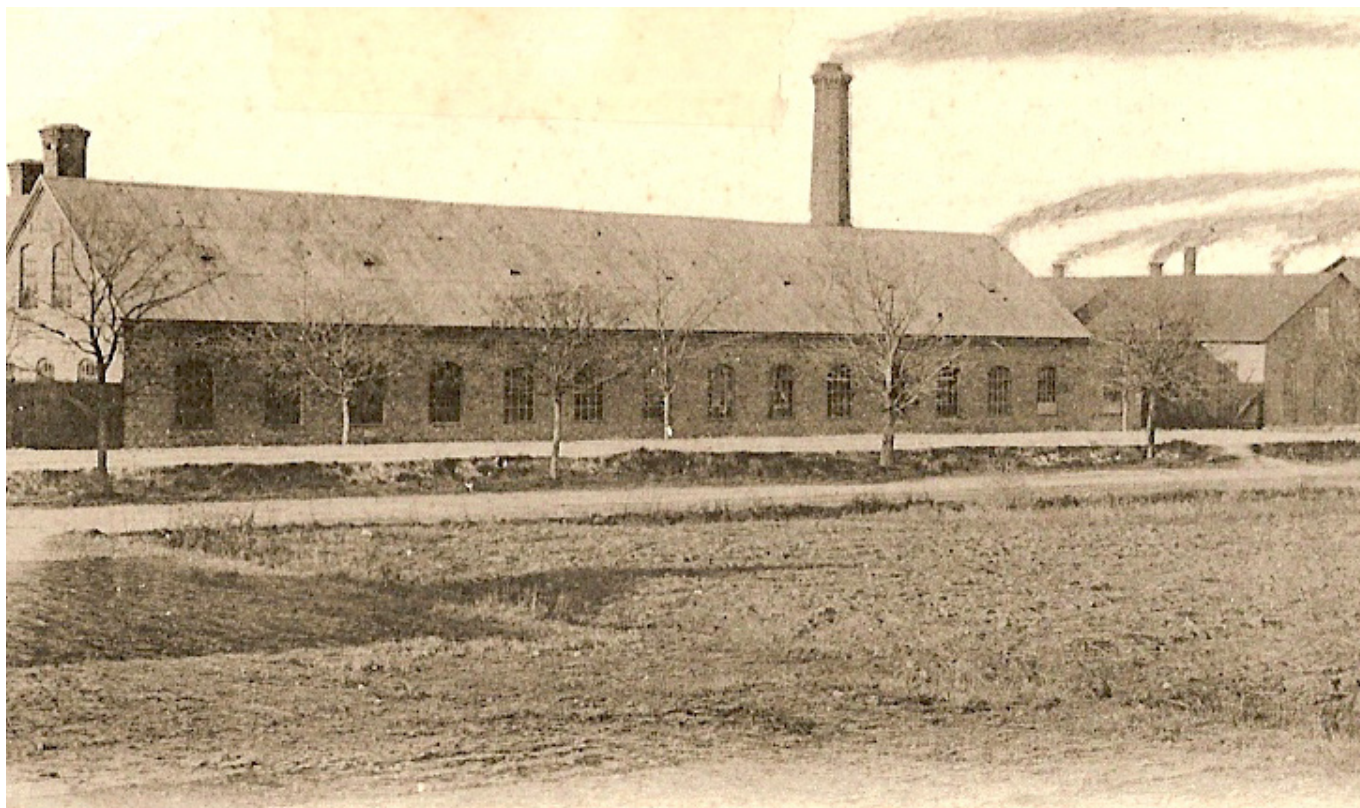
Fole mekaniska, Visby ca 1905.

Miljöfarliga ämnen har hamnat i miljön genom olika typer av verksamhet och mänsklig aktivitet, det kan vara allt från större industriell verksamhet till läckande villaoljecisterner. De ämnen som hamnat i miljön blir ofta kvar där under lång tid om vi inte gör något. Vid för höga halter kan människor eller miljön också ta skada. För att vi och kommande generationer ska kunna leva i en hälsosam miljö räcker det inte med att åtgärda dagens utsläpp utan vi måste också ta hand om gamla miljöskador.