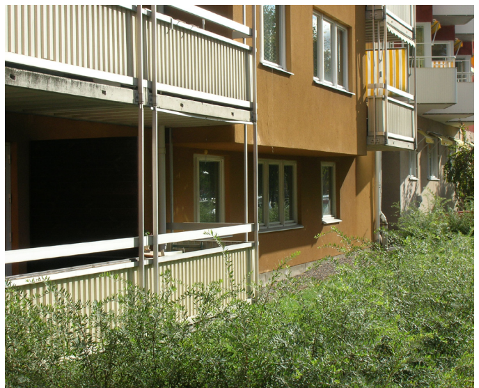
Under och efter en sanering av tidigare bensinmack. Svartbäcken i Uppsala.