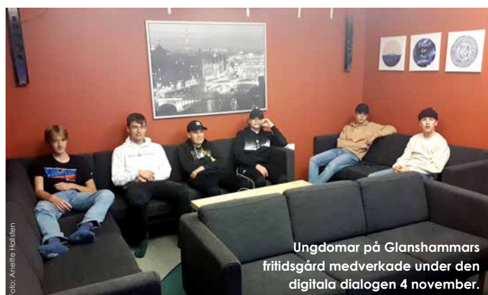
Ungdomar på Glanshammars fritidsgård medverkade under den digitala dialogen 4 november.

Eftersom Coronapandemin har hållit kvar sitt grepp under hösten har Landsbygdsnämnden dock för första gången helt ställt om till digitala medborgardialoger. Det har varit spännande, men också en stor utmaning där vi