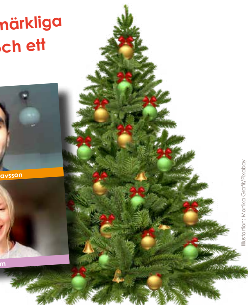
Illustration: Monika Grafik/Pixabay