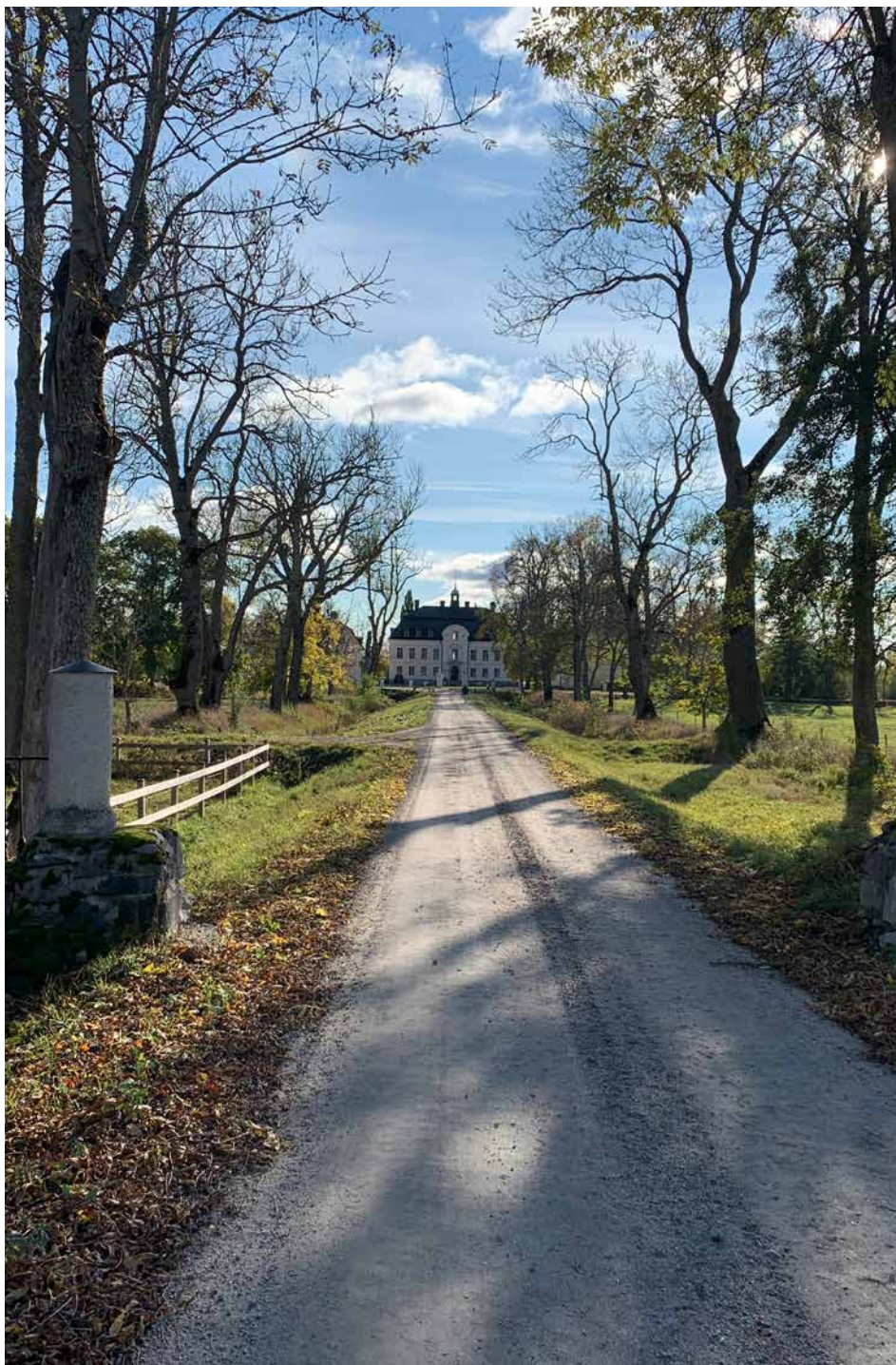
Esplunda är en herrgårdsanläggning från 1600-talet som ligger vid norra stranden vid Hemfjärden. Ett välkänt landmärke för invånarna i Glanshammar. Herrgården är skyddad som byggnadsminne och privatägd.

– Frågorna vi väljer att jobba med under de här tre åren får styra. Hur