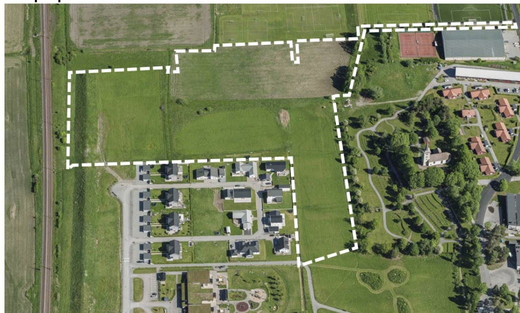
Bild på planområde

Syftet med detaljplanen är att möjliggöra för ny bostadsbebyggelse i form av småhus, flerbostadshus, radhus, parhus och liknande samt ett gruppboende. Detaljplanen ska bidra med att utveckla stadens norra del och skapa en sammanhängande stadsstruktur. Bebyggelsen och parkmiljön närmast Hovsta kyrka ska anpassas för att ta hänsyn till kyrkans kulturmiljö. I norra delen av staden finns ett högt bebyggelsetryck samt flera utpekade utbyggnadsområden som behöver utvecklas för att kommunen ska klara sitt bostadsförsörjningsansvar. Stor del av den förväntade befolkningsökningen fram till 2040 kommer ske i utpekade utvecklingsområden. Att utveckla bostäder här innebär även ett utökat befolkningsunderlag för att fortsätta utvecklingen av Lillån center som en kommunal kärna.